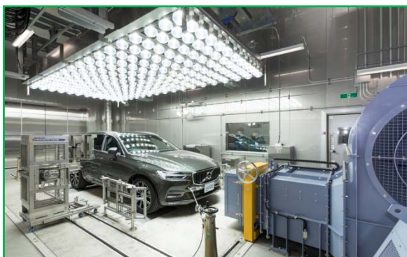
CD-5(4WD・環境型) (日射装置付)