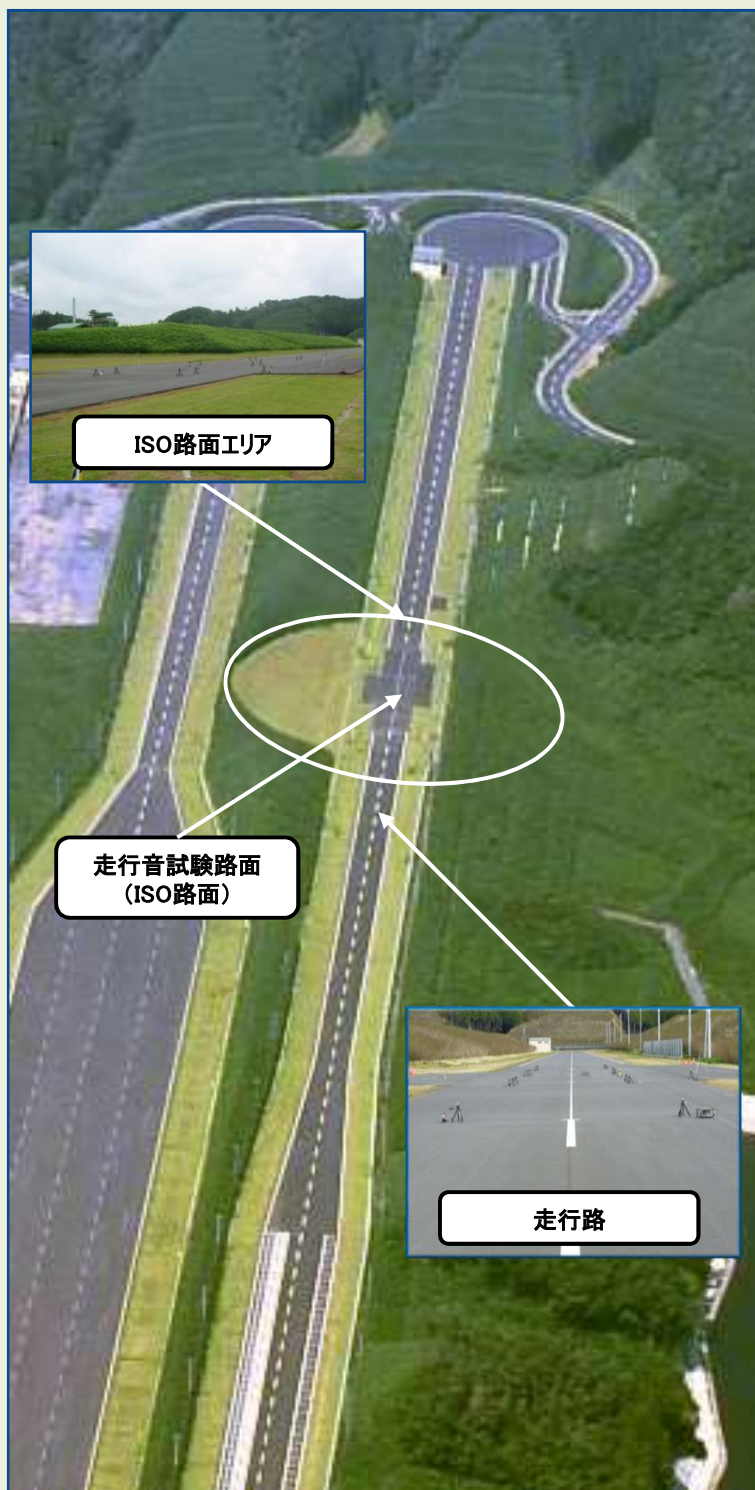
城里テストセンター 多用途試験路 全長: 1,500m