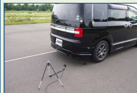
近接排気騒音試験